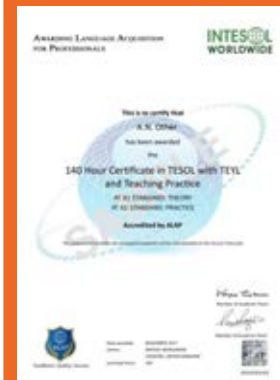
Chứng chỉ TESOL 140H