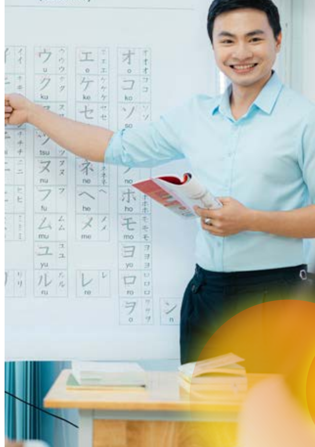
Bảng chữ cái Katakana (Katakana)

Chuyên ngành Nhật Bản học nghiên cứu chuyên sâu về văn hóa, lịch sử, kinh tế, chính trị, kết hợp với kỹ năng tiếng Nhật và kỹ năng nghề nghiệp đáp ứng yêu cầu trong các lĩnh vực chuyên môn có sử dụng tiếng Nhật và các kiến thức liên quan đến Nhật Bản. Chương trình đào tạo được chia làm hai nhóm học phần: Hành chính – Văn phòng và Văn hóa – Du lịch.