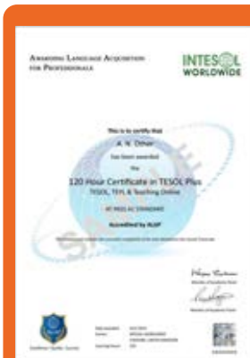
Chứng chỉ TESOL 120H