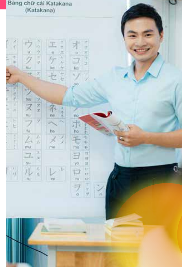
Bảng chữ cái Katakana (Katakana)

Chuyên ngành Nhật Bản học nghiên cứu chuyên sâu về văn hóa, lịch sử, kinh tế, chính trị, kết hợp với kỹ năng tiếng Nhật và kỹ năng nghề nghiệp đáp ứng yêu cầu trong các lĩnh vực chuyên môn có sử dụng tiếng Nhật và các kiến thức liên quan đến Nhật Bản. Chương trình đào tạo được chia làm hai nhóm học phần: Hành chính – Văn phòng và Văn hóa – Du lịch.